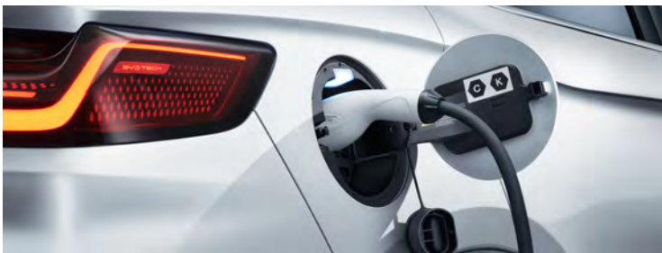
VTOL 功能 · V2L Function