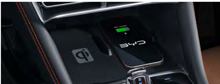
2 個無線充電功能 (15W) · 2 Wireless Phone Charger (15W)