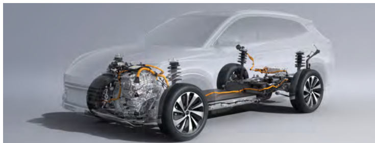
DM-i 超級混能技術 · DM-i SUPER HYBRID