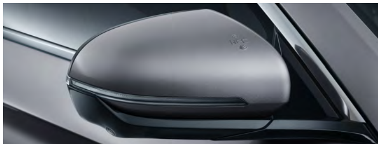
NFC 及藍牙車匙 · NFC & Bluetooth Car Key